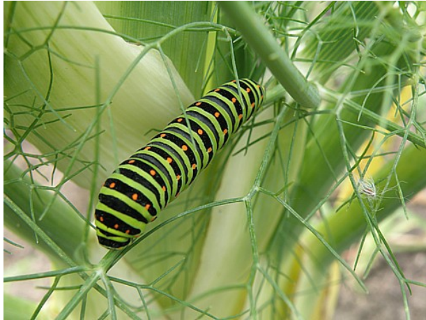
Rups van de Koninginnepage op venkel

Alle informatie is bij elkaar gezocht in diverse boeken en bronnen op internet. De foto's van de vlinder zijn van eigen hand. De foto van de rups en de tekening van de levenscyclus zijn van internet.